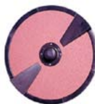
piattello abrasivo per patate abrasive plate for potatoes tournette abrasive pour pommes de terre