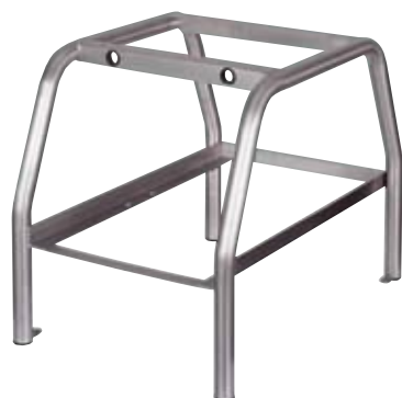
cavalletto stand untergestell