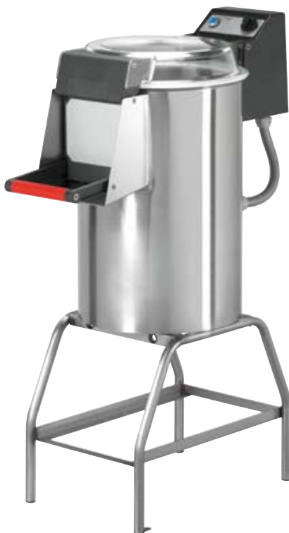
P 10 con cavalletto inox with stainless steel stand avec support en acier Inox