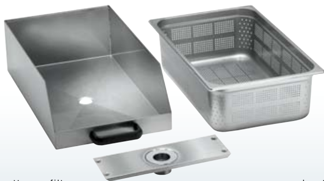
cassetto con filtro cartridge filter tiroir avec filtre