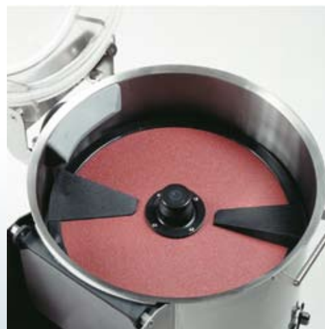
pelapatate P5 aperto potatopeeler P5 open eplucheur à pommes de terre P5 ouvert