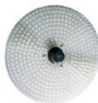
piattello per cozze plate for mussels tournette pour moules