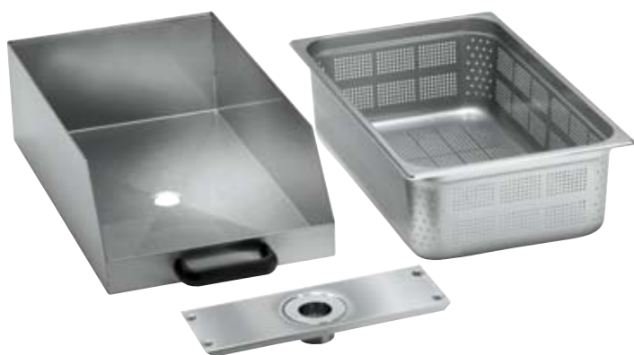
cassetto con filtro cartridge filter tiroir avec filtre