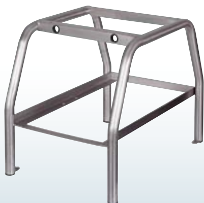
cavalletto stand untergestell