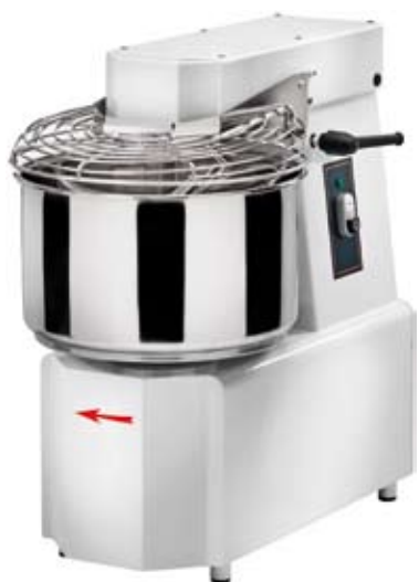
TSV versione estraibile TSV version with removable bowl TSV version amovible