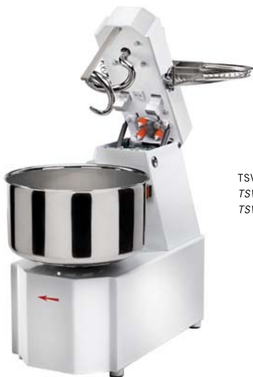
TSVX versione estraibile TSVX version with removable bowl TSVX version amovible