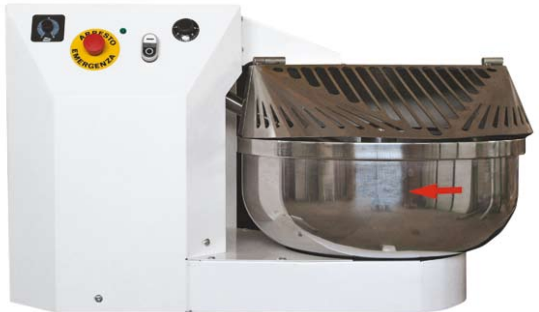
F30 chiusa closed fermé