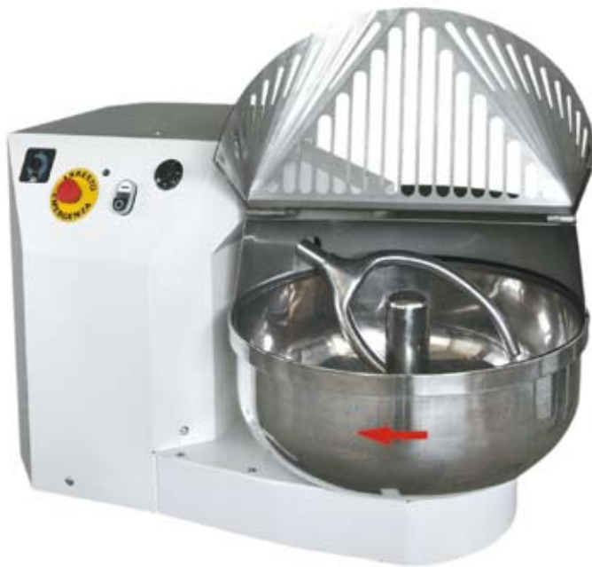
F30 aperta open ouvert