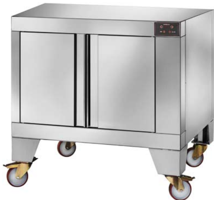
cella di lievitazione leavening cell chambre de levitation