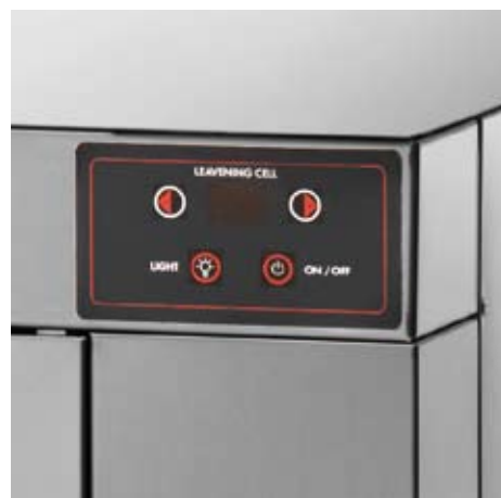
pannello comandi control panel panneau de contrôle