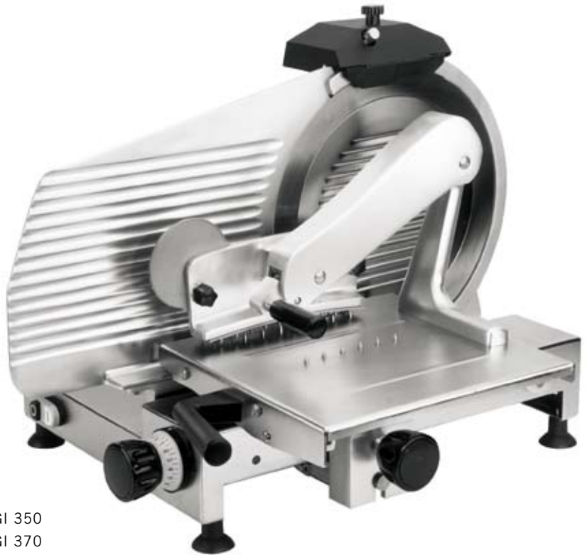
GI 350 GI 370